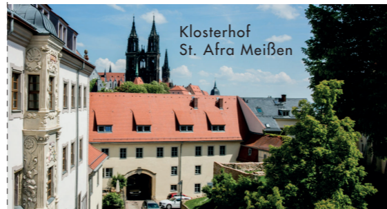
Klosterhof St. Afra Meißen